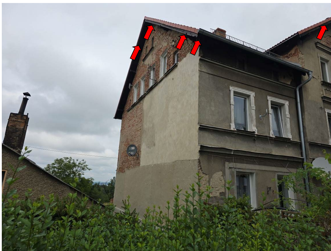
Fot. 3. Ogólny widok elewacji budynku - miejsca lęgowe jerzyków.