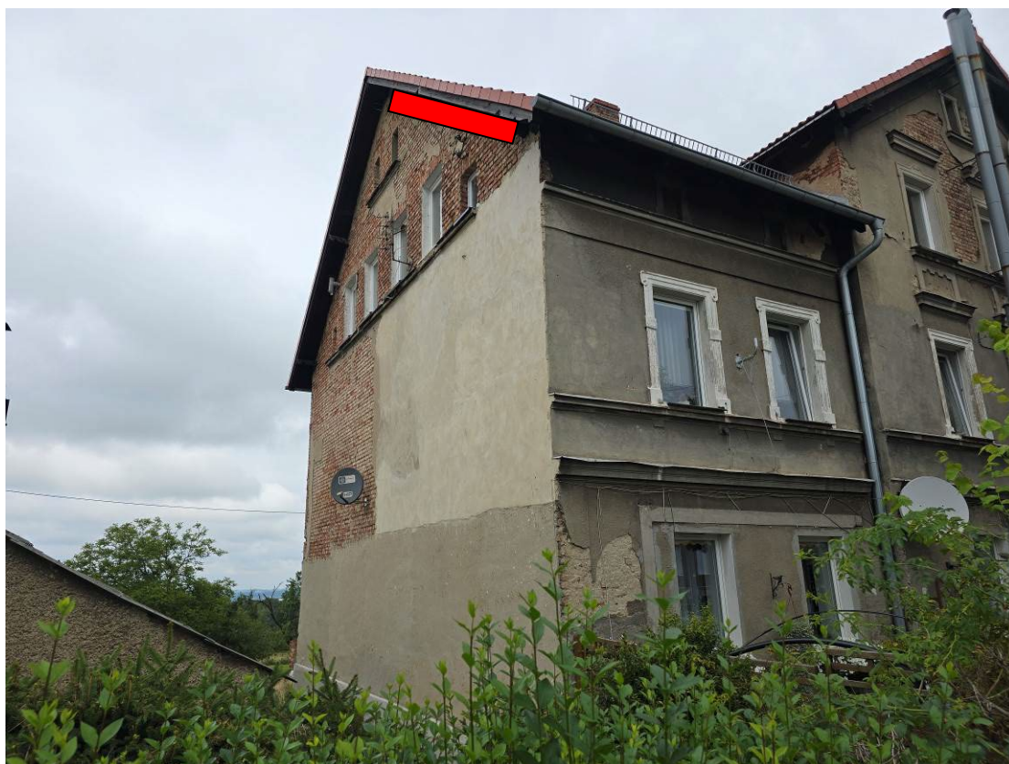
Fot. 6. Miejsce zamontowania budek.

wysokości w miarę możliwości ponad 4 m od ziemi. Budki dla jerzyków należy wywiesić na ścianie od strony podwórza tuż pod dachem. Prace termomodernizacyjne można prowadzić w okresie lęgowym pod nadzorem ornitologa w odległości nie mniejszej niż 4 m od stwierdzonych siedlisk jerzyków, oraz w sposób umożliwiający swobodny dostęp do siedlisk lęgowych ptaków.