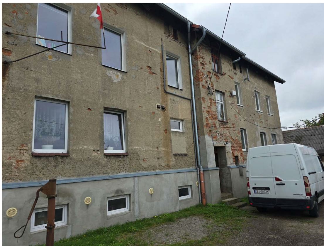
Fot. 2. Ogólny widok elewacji budynku.