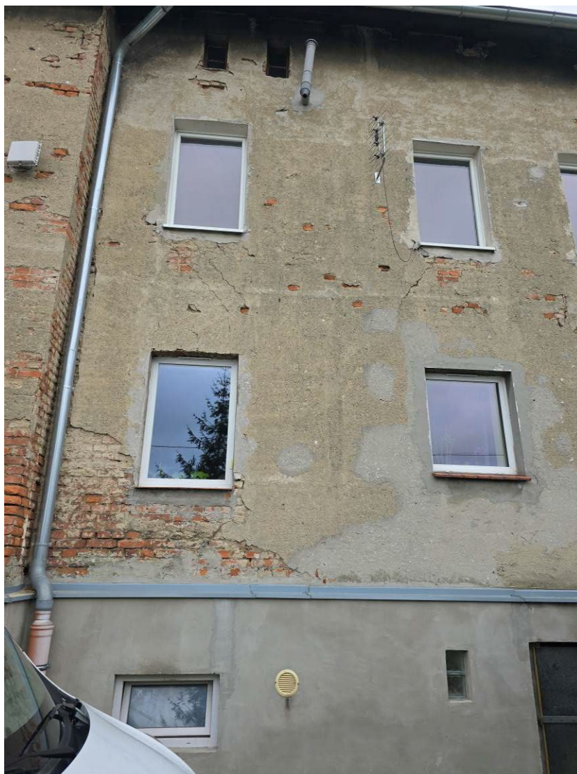
Fot. 4. Ogólny widok elewacji budynku.