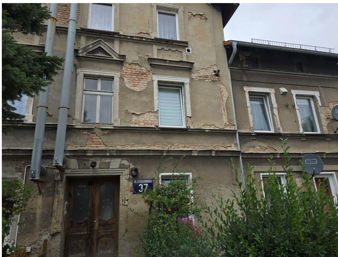
Fot. 1. Ogólny widok budynku.

W czasie badań ww. budynku nie stwierdzono potencjalnych miejsc rozrodczych dla nietoperzy, nie stwierdzono również samych zwierząt