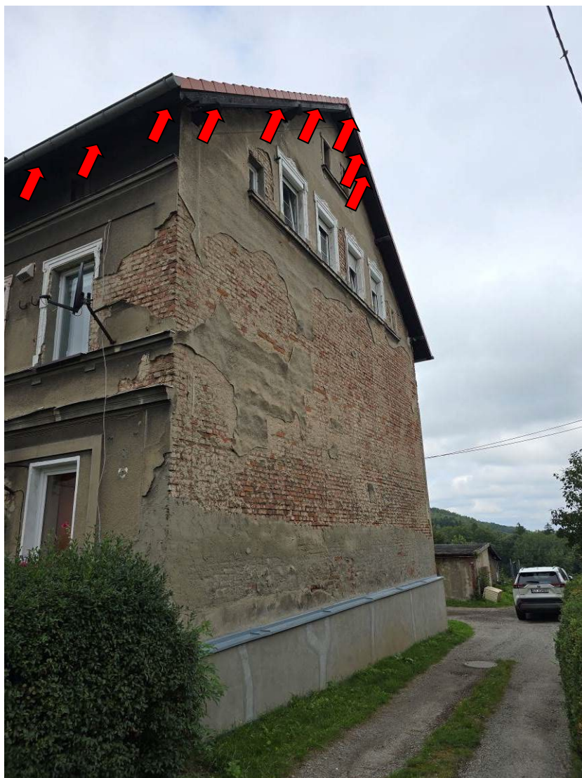
Fot. 5. Ogólny widok elewacji budynku - miejsca lęgowe jerzyków.